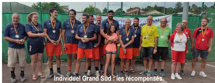
Individuel Grand Sud : les récompensés.