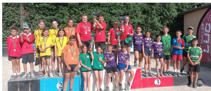
Les récompensés dans les catégories écoles de quilles.