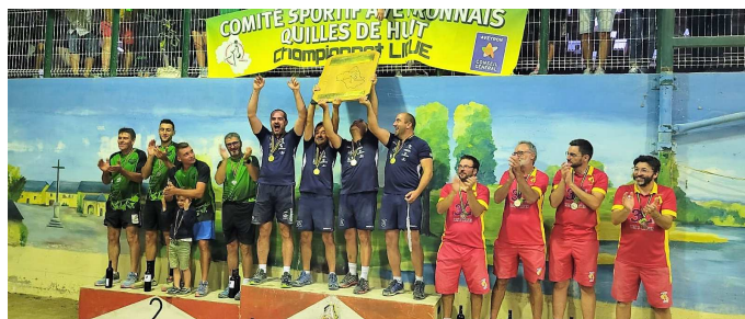
Le podium seniors hommes excellence Aveyron.