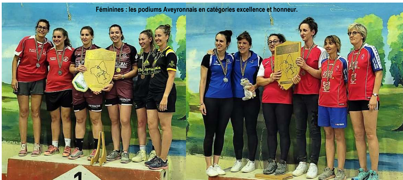
Féminines : les podiums Aveyronnais en catégories excellence et honneur.

Nous partageons la peine et la tristesse de ces clubs, des familles et les assurons de nos plus sincères condoléances.