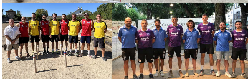
Colombiès contre Gages.